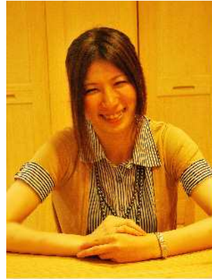
インテリアコーディネーター

とお考えの方には、とっても参考になる家づくりを、 30組様限定でご案内させていただきます。